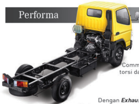
Rear Over Hang (ROH) 2M